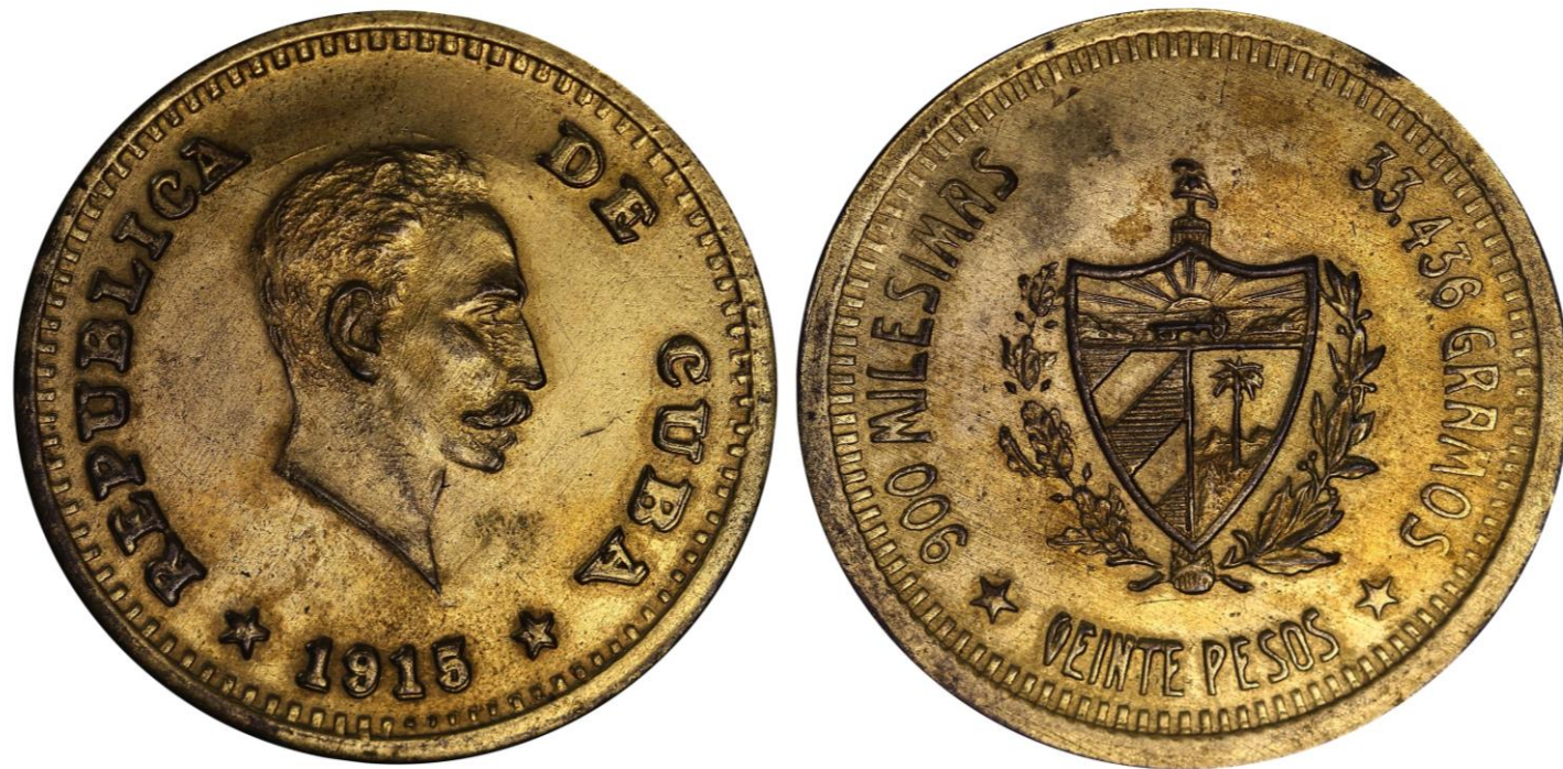
Aleación de Oro Bajo