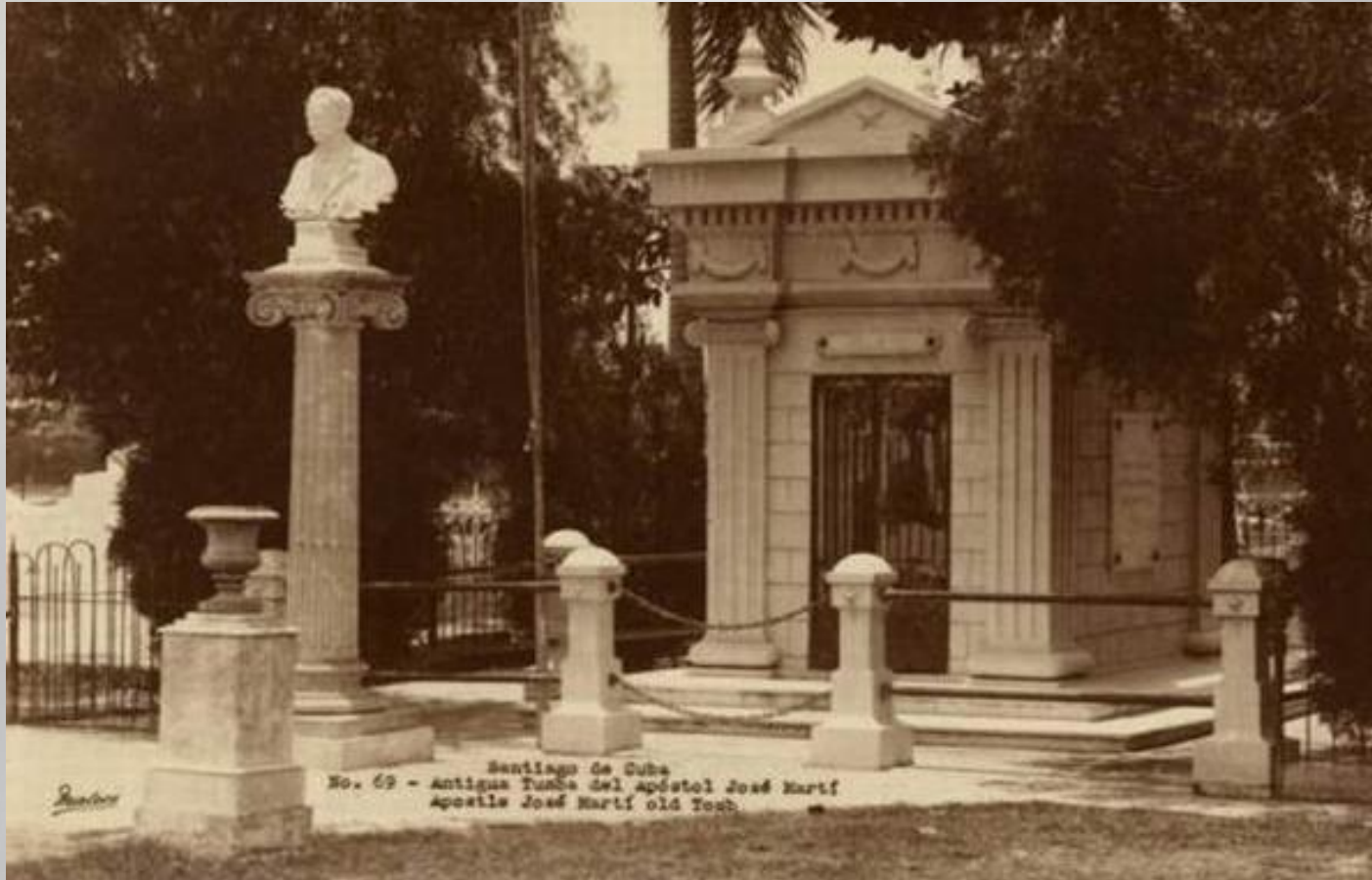
Santiago de Cuba No. 69 - Antigua Tumba del apóstol José Martí Apóstol José Martí old Tomb