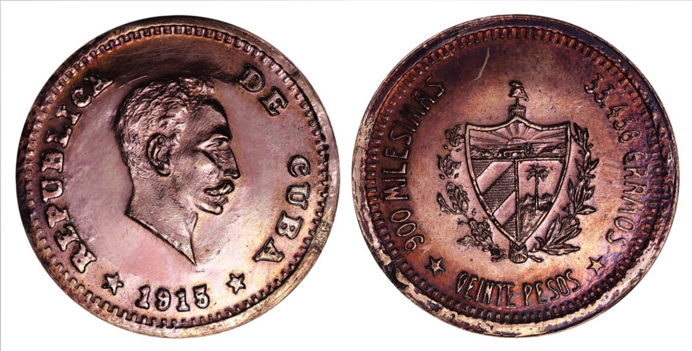
Aleación de cobre