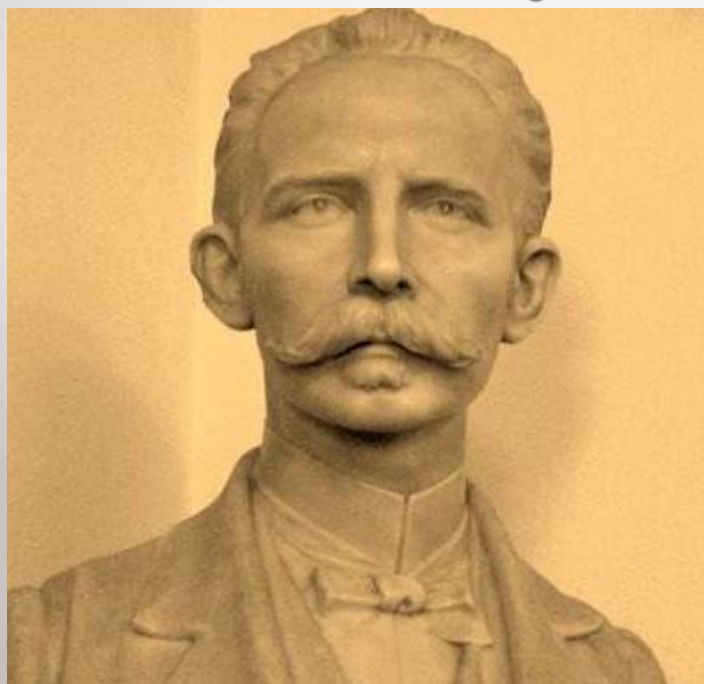
Ugo Luisi Escultor Italiano